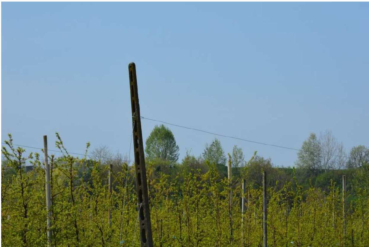
FOTO 014 - Sommità della scarpata vista dalla sponda opposta del torrente Marzeno