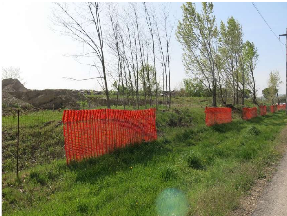
FOTO 059 - Recinzione e barriera verde sul lato settentrionale - accumuli di terreno vegetale accantonato per la rinaturalizzazione del sito