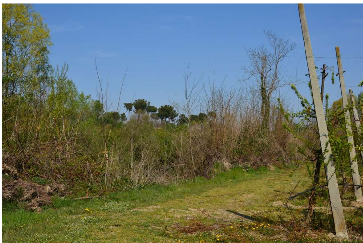
FOTO 008 - La scarpata delle chiuse del Marzeno vista dalla sponda opposta del torrente