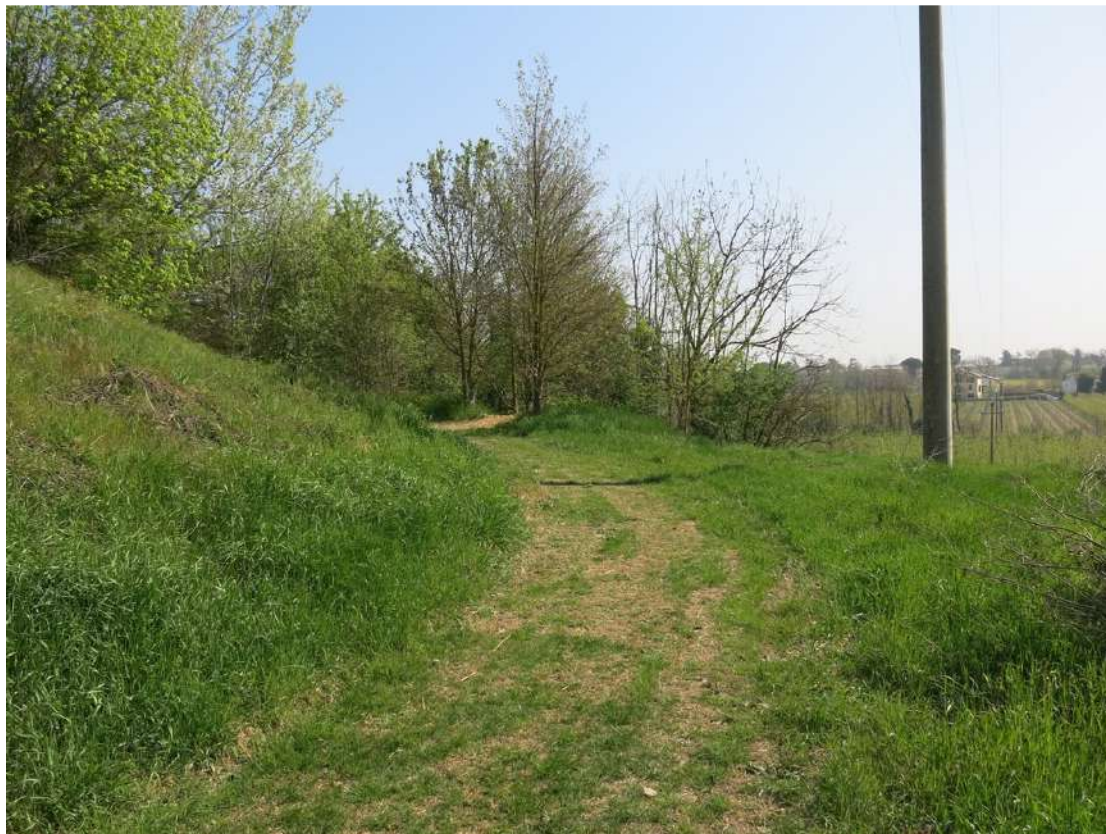
FOTO 052 - accumuli di terreno vegetale accantonato per la rinaturalizzazione del sito