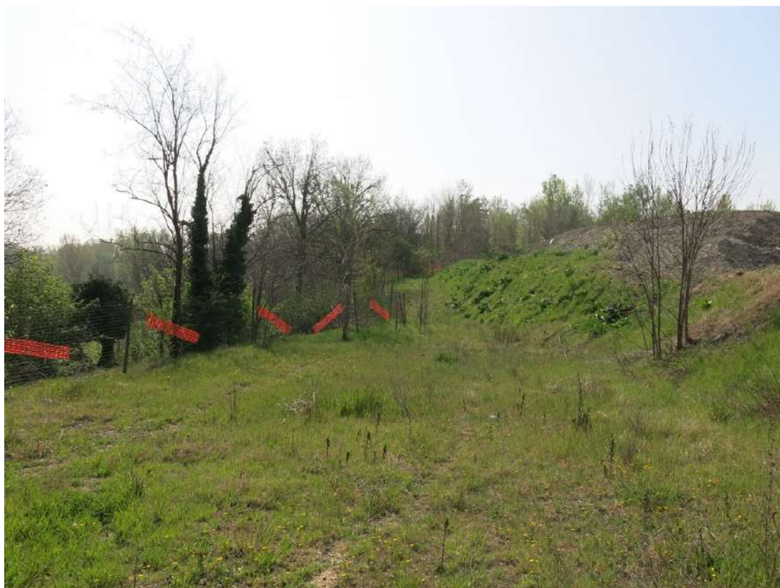
FOTO 029 - Sommità della scarpata delle chiuse del Marzeno dall' interno dell' area di Cava