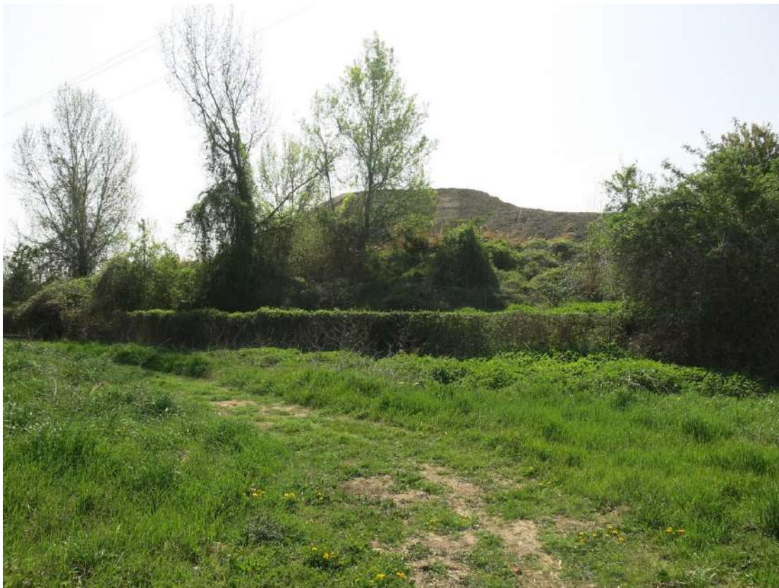
FOTO 058 - Recinzione e barriera verde sul lato settentrionale - accumuli di terreno vegetale accantonato per la rinaturalizzazione del sito - accumuli di materiale in lavorazione all' interno dell' area di cava