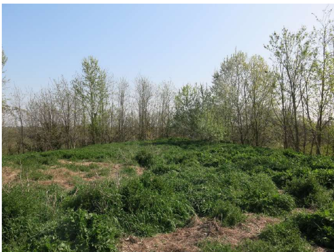
FOTO 032 - Accumuli di terreno vegetale accantonato per la rinaturalizzazione del sito sul lato meridionale verso la via Pittora