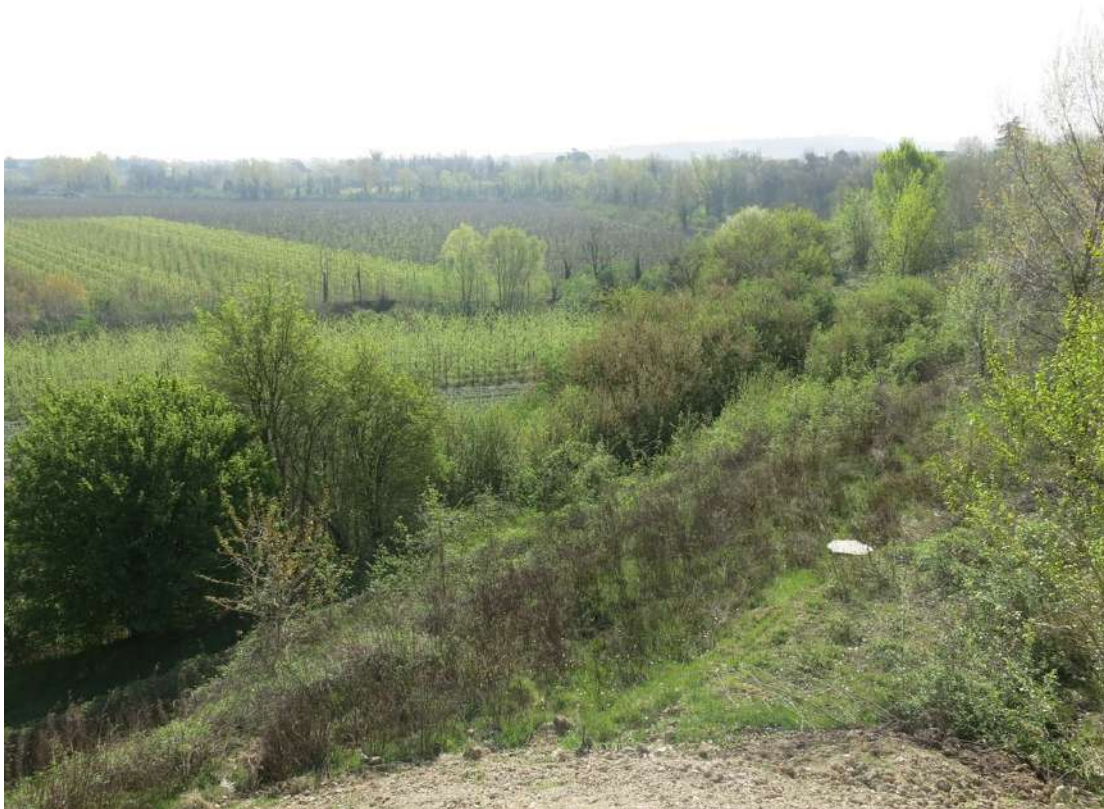
FOTO 019 - Scarpata delle chiuse del Marzeno vista dall' interno dell' area di cava dalla sommità di un accumulo temporaneo di materiale in lavorazione