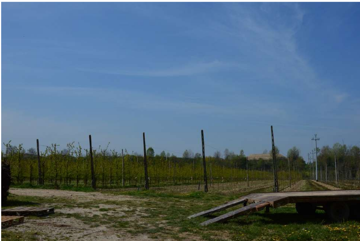
FOTO 015 - Accumuli temporanei di materiale in lavorazione all' interno dell' area di cava, visti dalla sponda opposta del torrente Marzeno