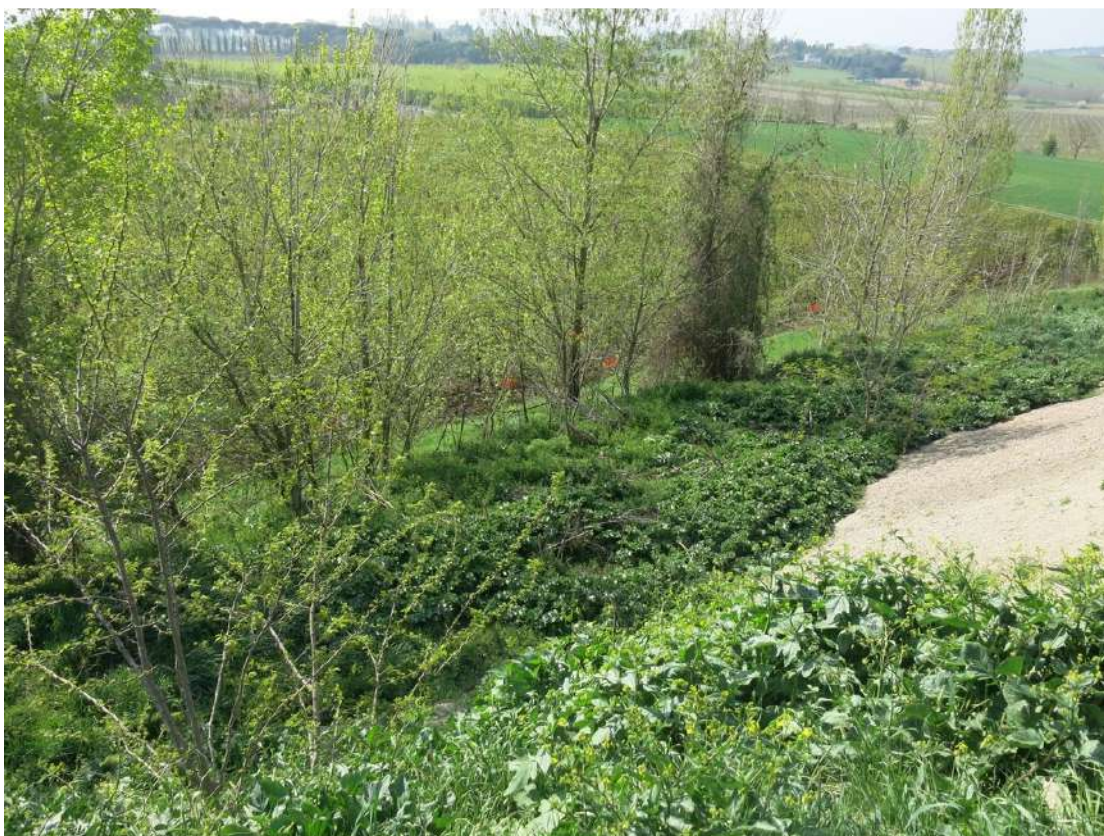
FOTO 035 - Accumuli di terreno vegetale accantonato per la rinaturalizzazione del sito sul lato meridionale verso la via Pittora