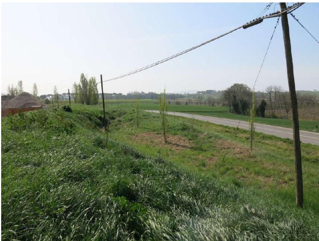
FOTO 047 - Recinzione e barriera verde sul lato occidentale - accumuli di terreno vegetale accantonato per la rinaturalizzazione del sito