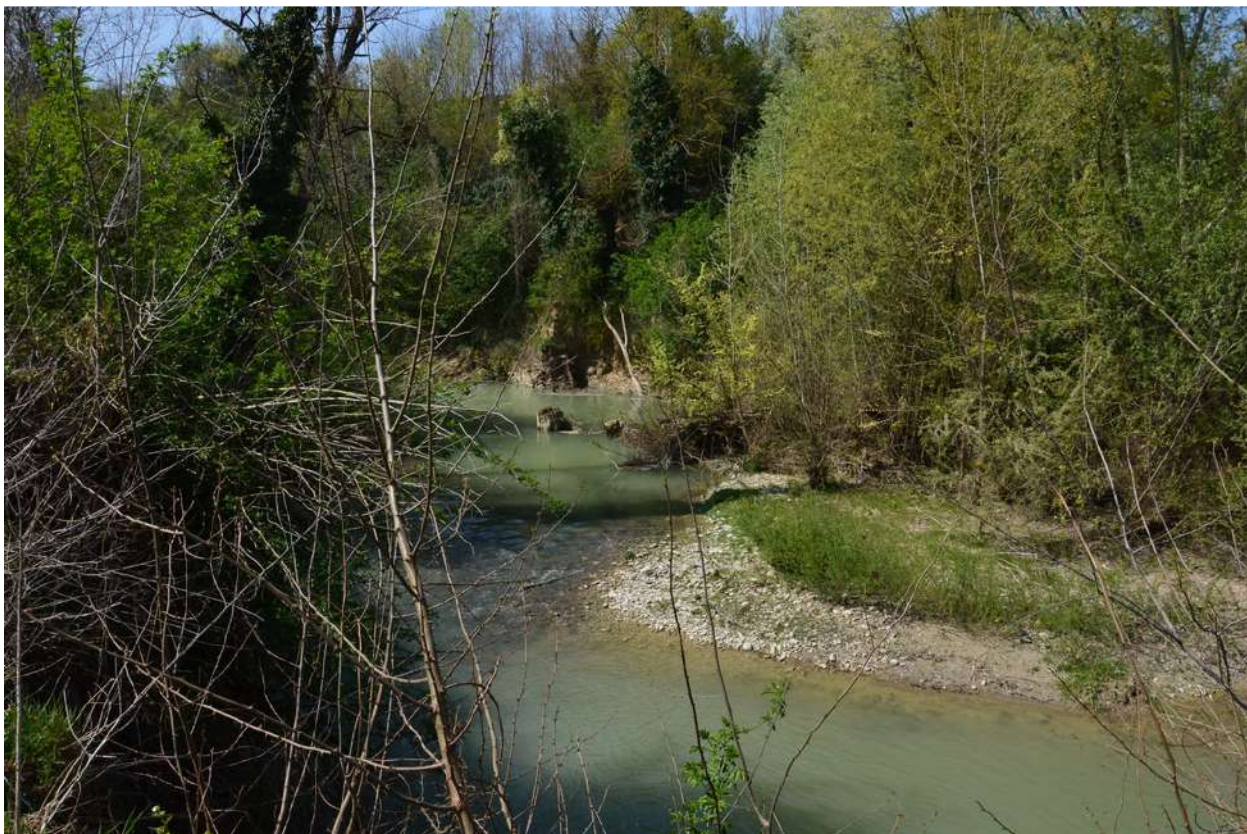
FOTO 011 - Alveo del torrente Marzeno visto dalla sponda opposta alla scarpata