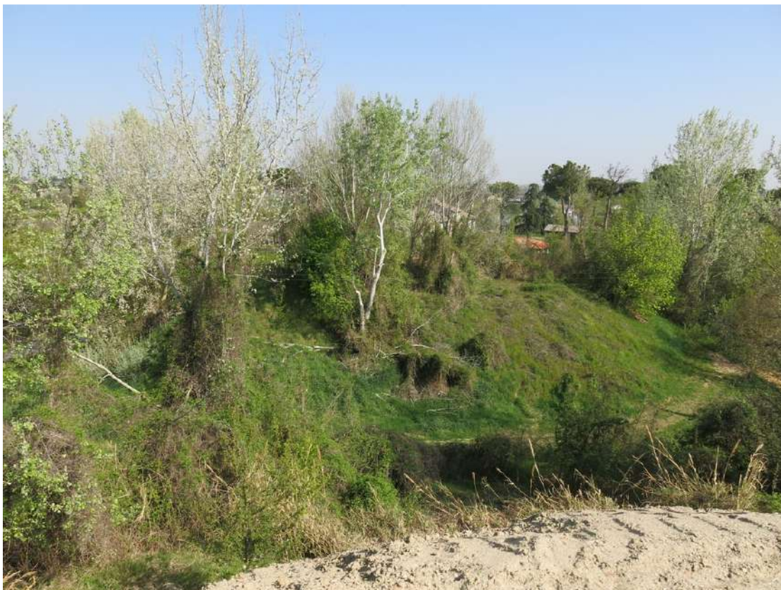
FOTO 023 - Scarpata delle chiuse del Marzeno vista dall' interno dell' area di cava dalla sommità di un accumulo temporaneo di materiale in lavorazione