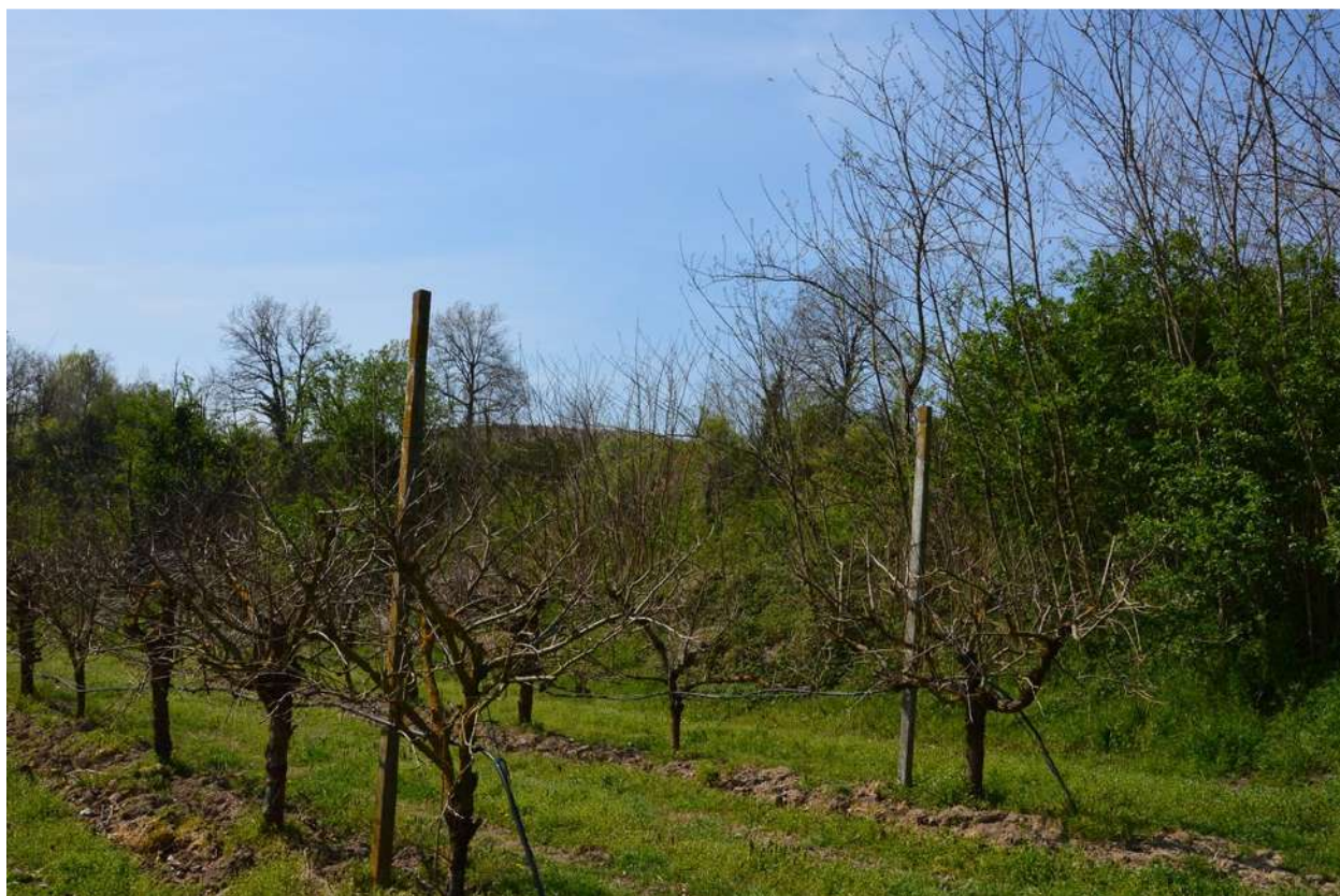
FOTO 007 - La scarpata delle chiuse del Marzeno vista dalla sponda opposta del torrente