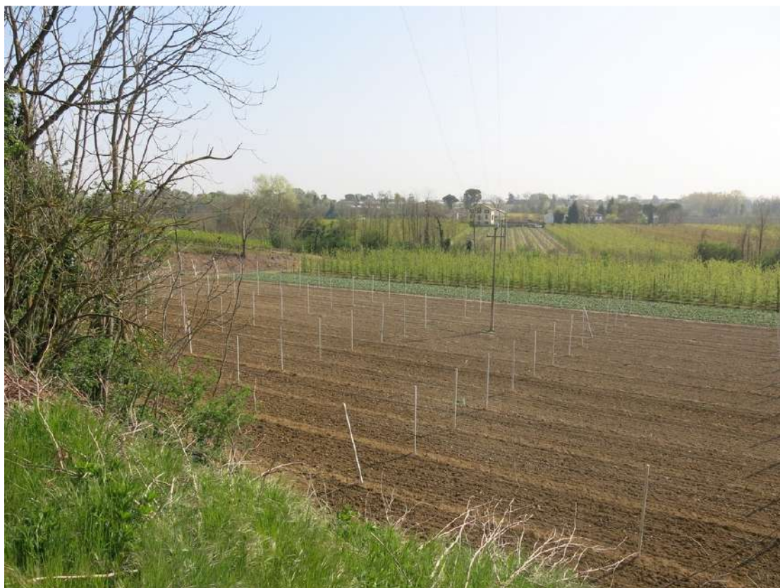
FOTO 053 - Sommità scarpata delle chiuse del torrente Marzeno