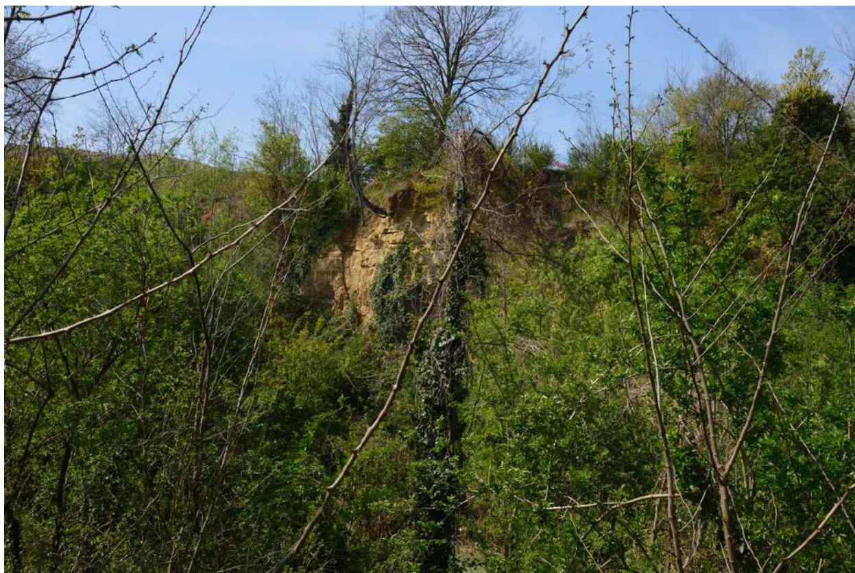
FOTO 009 - La scarpata delle chiuse del Marzeno vista dalla sponda opposta del torrente