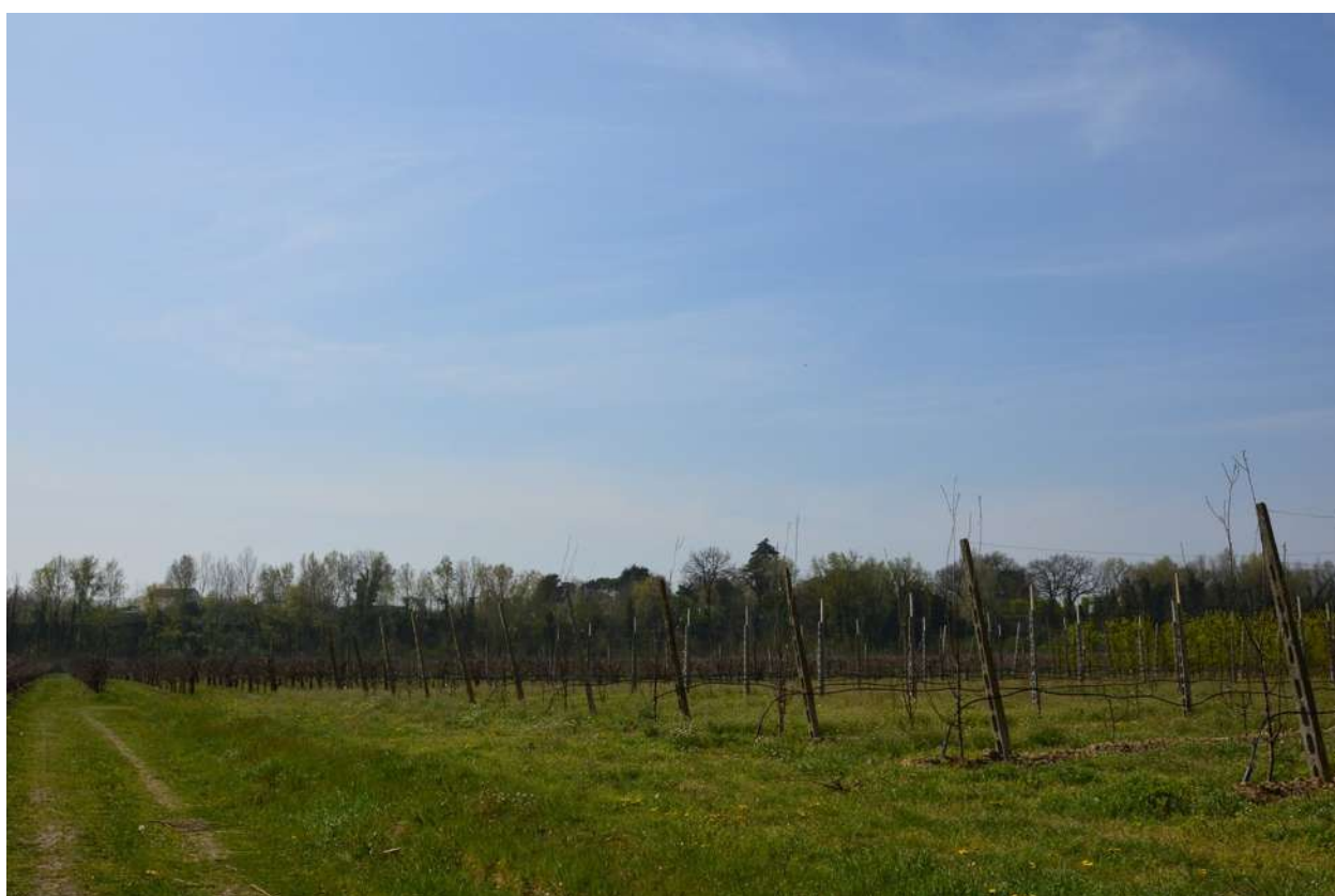
FOTO 004 - La scarpata delle chiuse del Marzeno vista da Via Sbirra