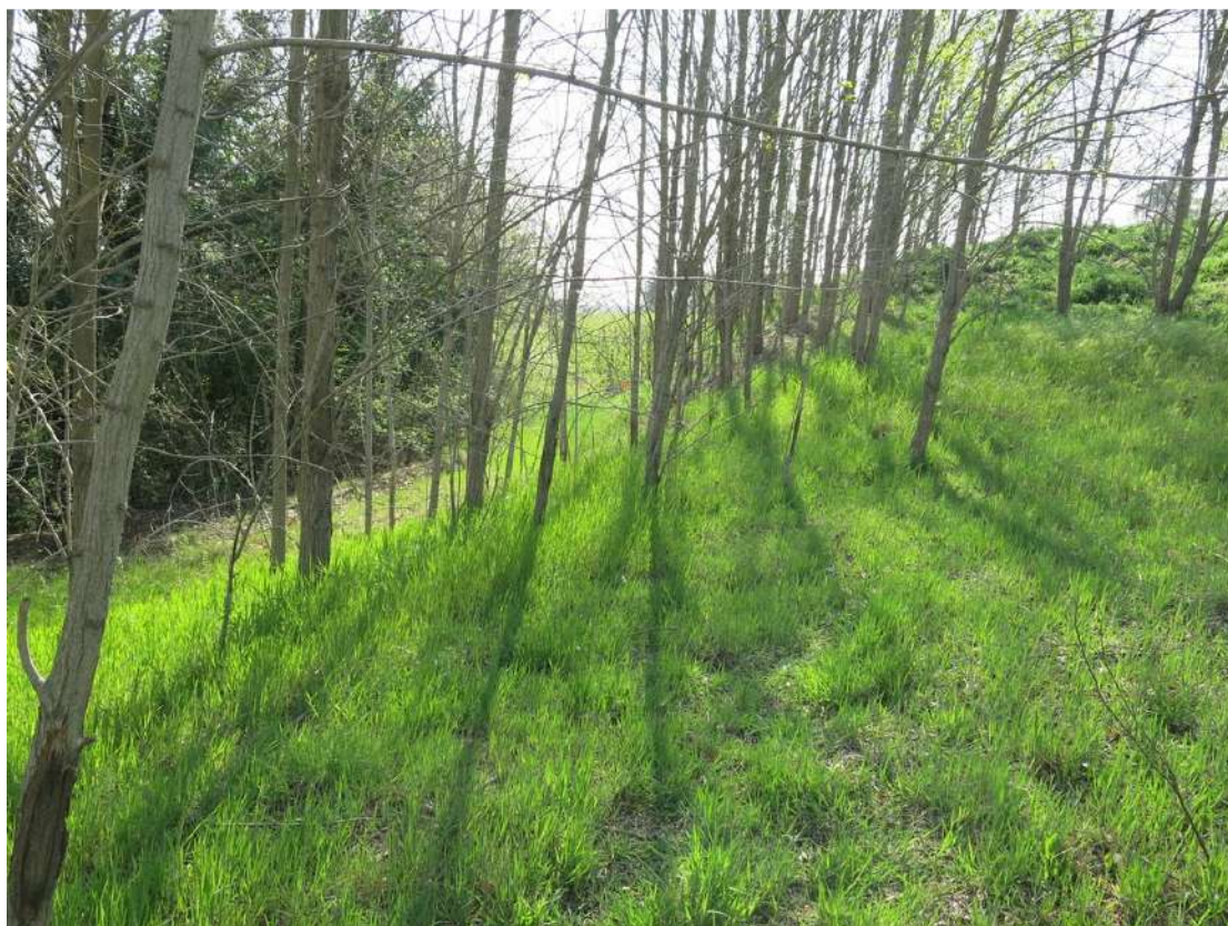
FOTO 031 - Sommità della scarpata delle chiuse del Marzeno dall' interno dell' area di Cava