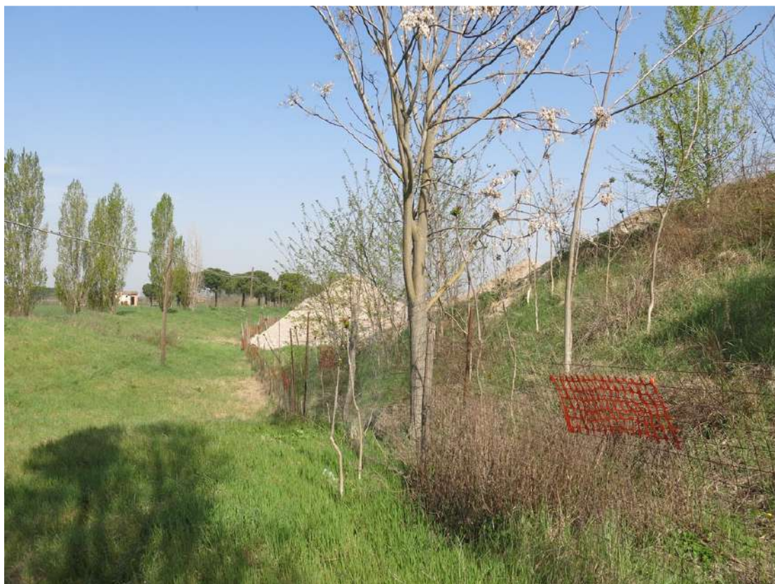
FOTO 039 - Recinzione e barriera verde sul lato occidentale - accumuli di terreno vegetale accantonato per la rinaturalizzazione del sito