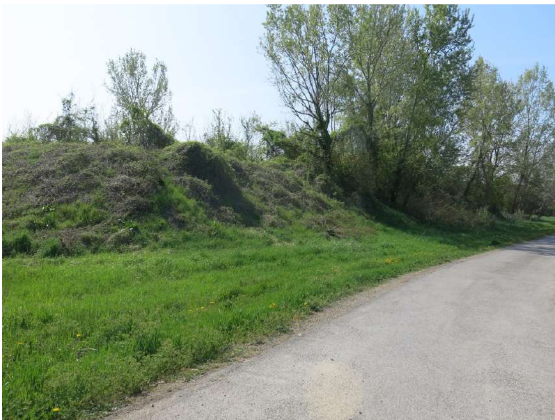
FOTO 055 - accumuli di terreno vegetale accantonato per la rinaturalizzazione del sito visti dalla strada di accesso al fondo Pignattara