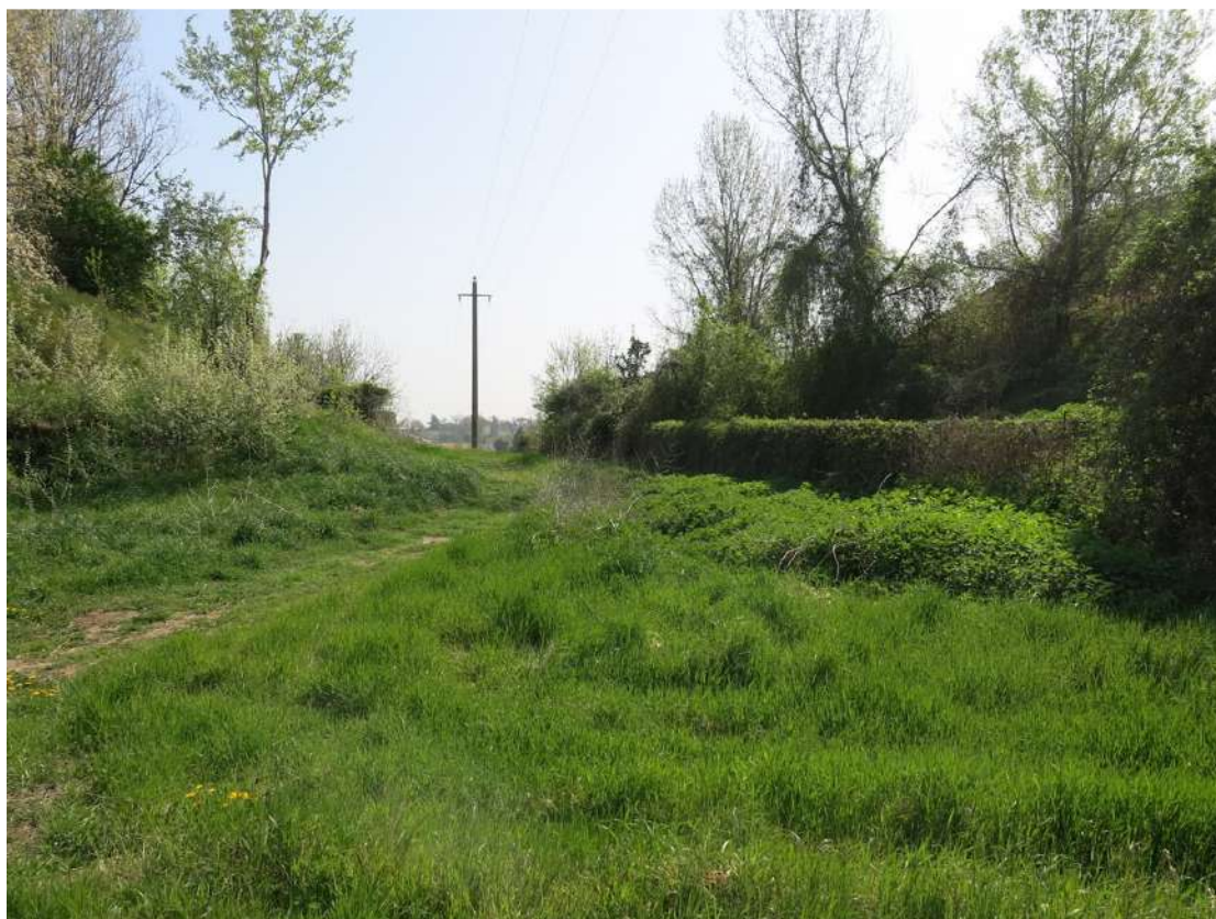
FOTO 049 - Recinzione e barriera verde sul lato settentrionale - accumuli di terreno vegetale accantonato per la rinaturalizzazione del sito