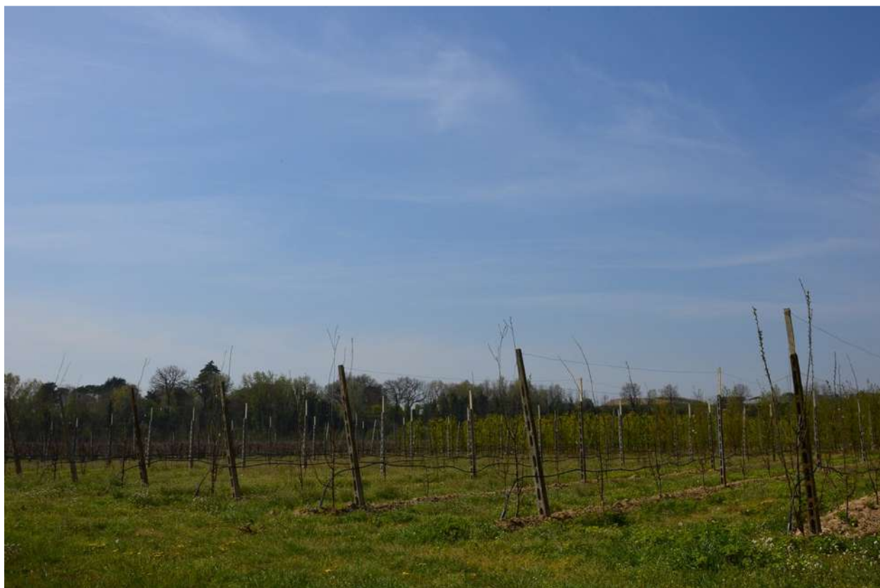
FOTO 003 - La scarpata delle chiuse del Marzeno vista da Via Sbirra