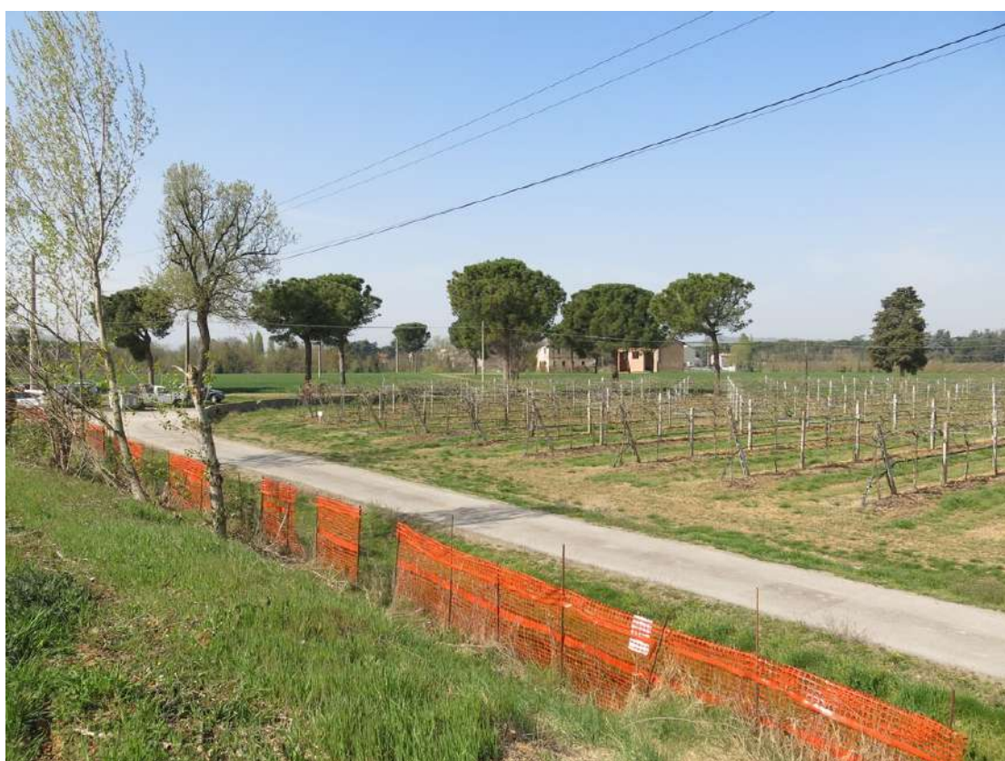
FOTO 026 - Recinzione e barriera verde dell' area di cava sulla strada di accesso al fondo "Pignattara"