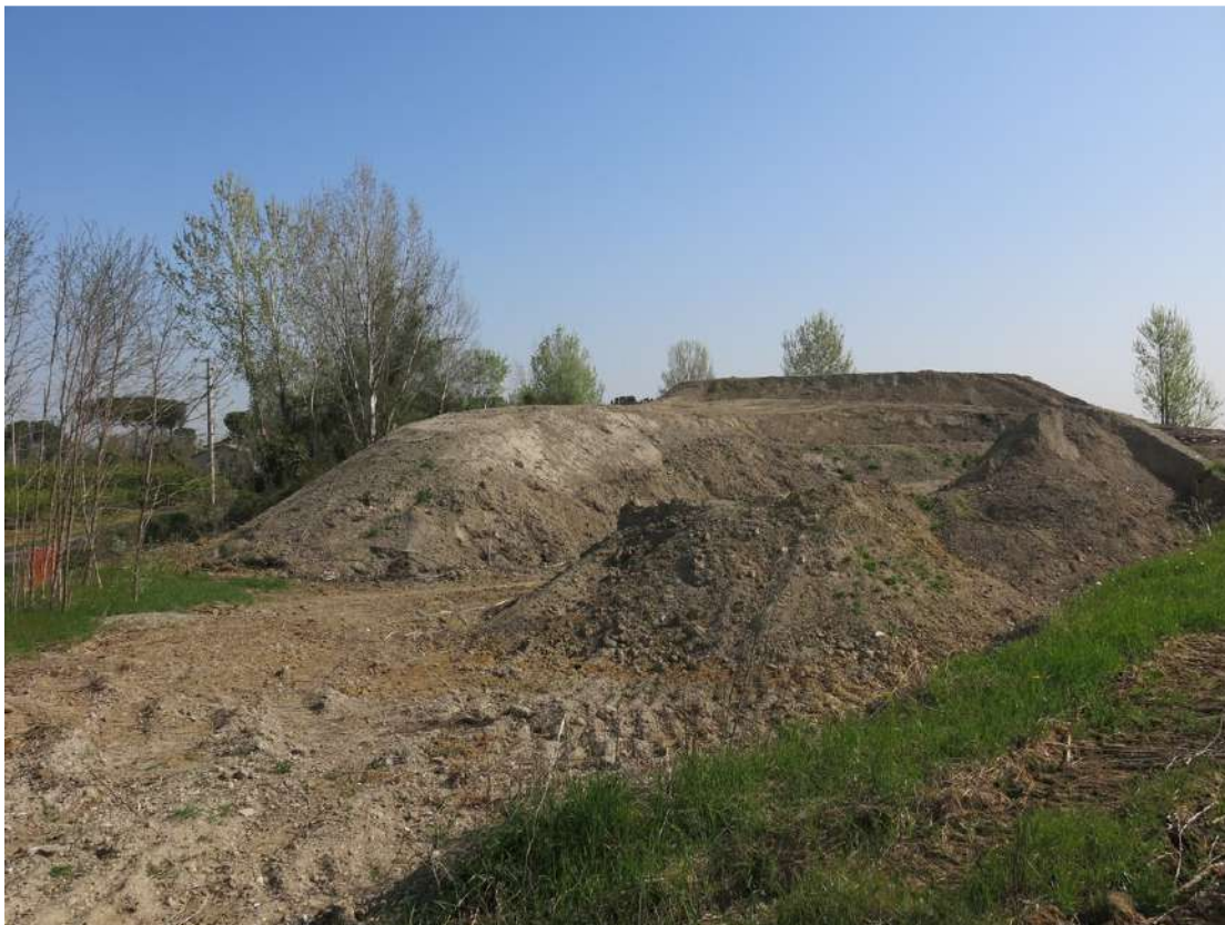
FOTO 024 - Accumulo temporaneo di materiale all' interno dell' area di cava