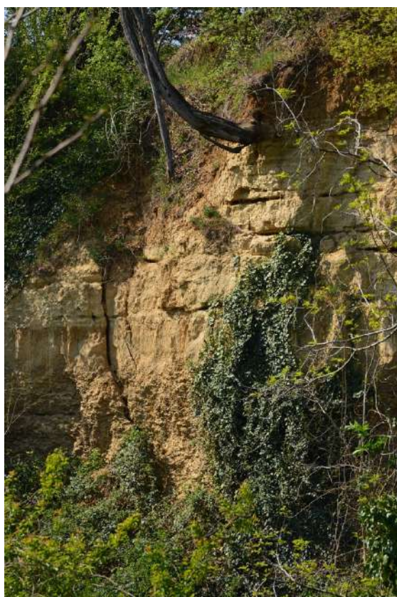
FOTO 010 - Dettaglio della scarpata delle chiuse del Marzeno (o scarpata di Pittora) vista dalla sponda opposta del torrente