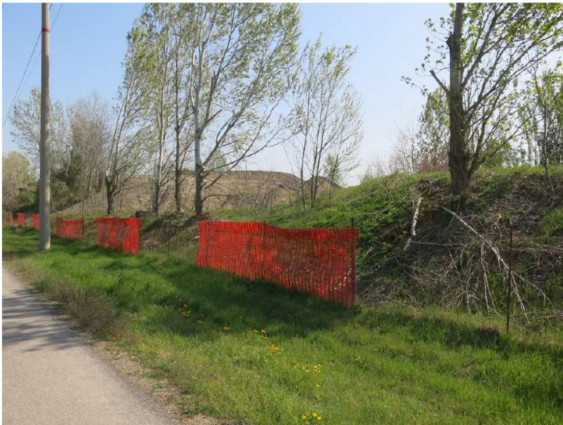
FOTO 048 - Recinzione e barriera verde sul lato settentrionale - accumuli di terreno vegetale accantonato per la rinaturalizzazione del sito