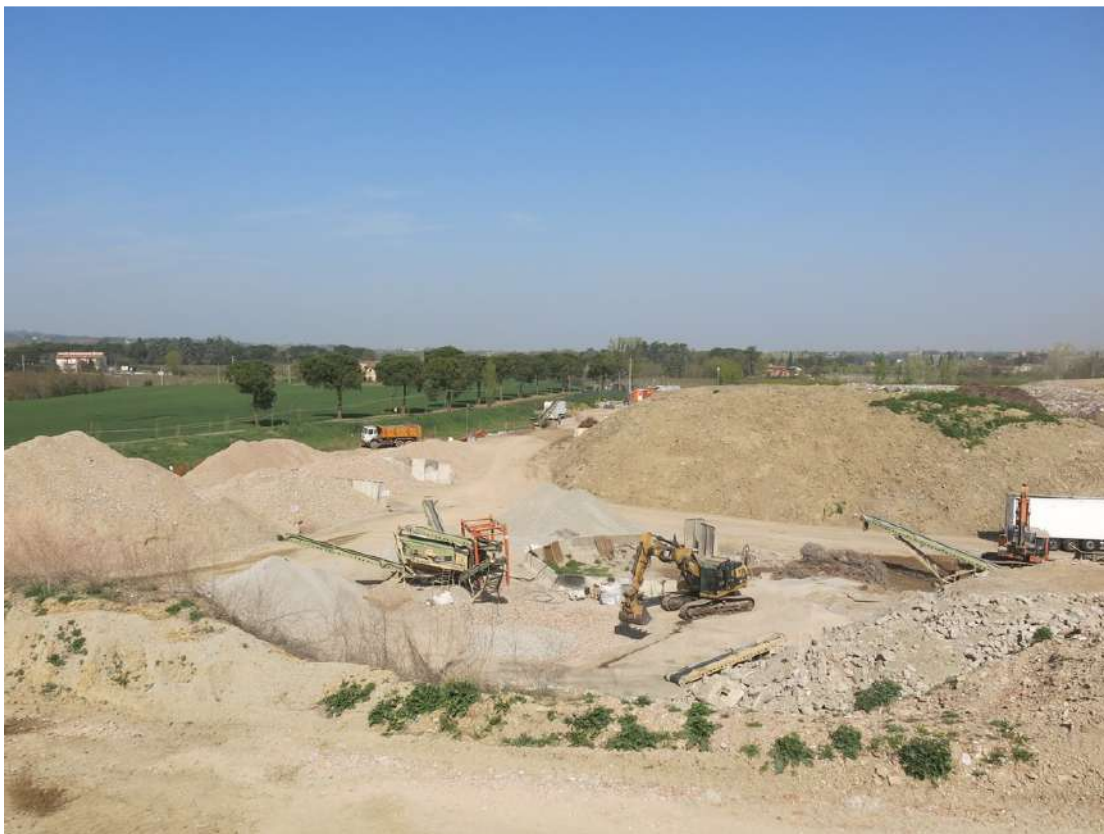
FOTO 037 - Area di lavorazione inerti all' interno dell' area di cava