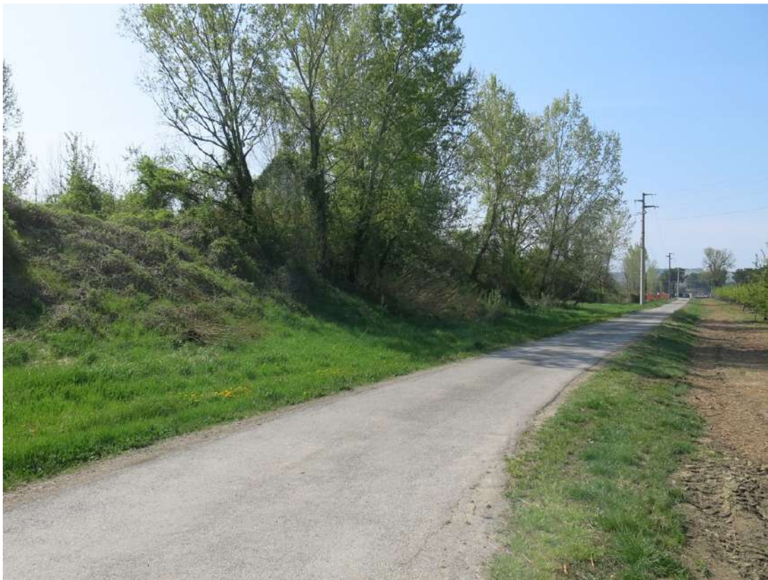
FOTO 056 - accumuli di terreno vegetale accantonato per la rinaturalizzazione del sito visti dalla strada di accesso al fondo Pignattara