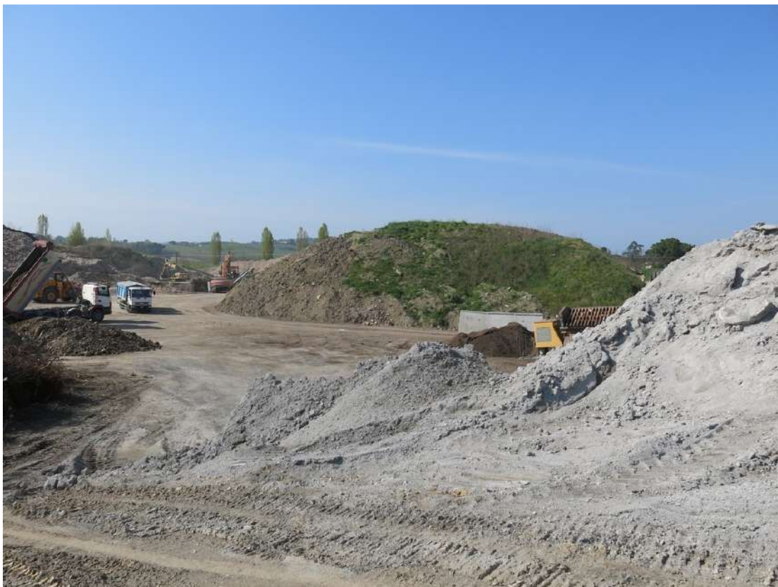
FOTO 017 - Accumuli temporanei di materiale in lavorazione all' interno dell' area di cava visti dalla viabilità interna