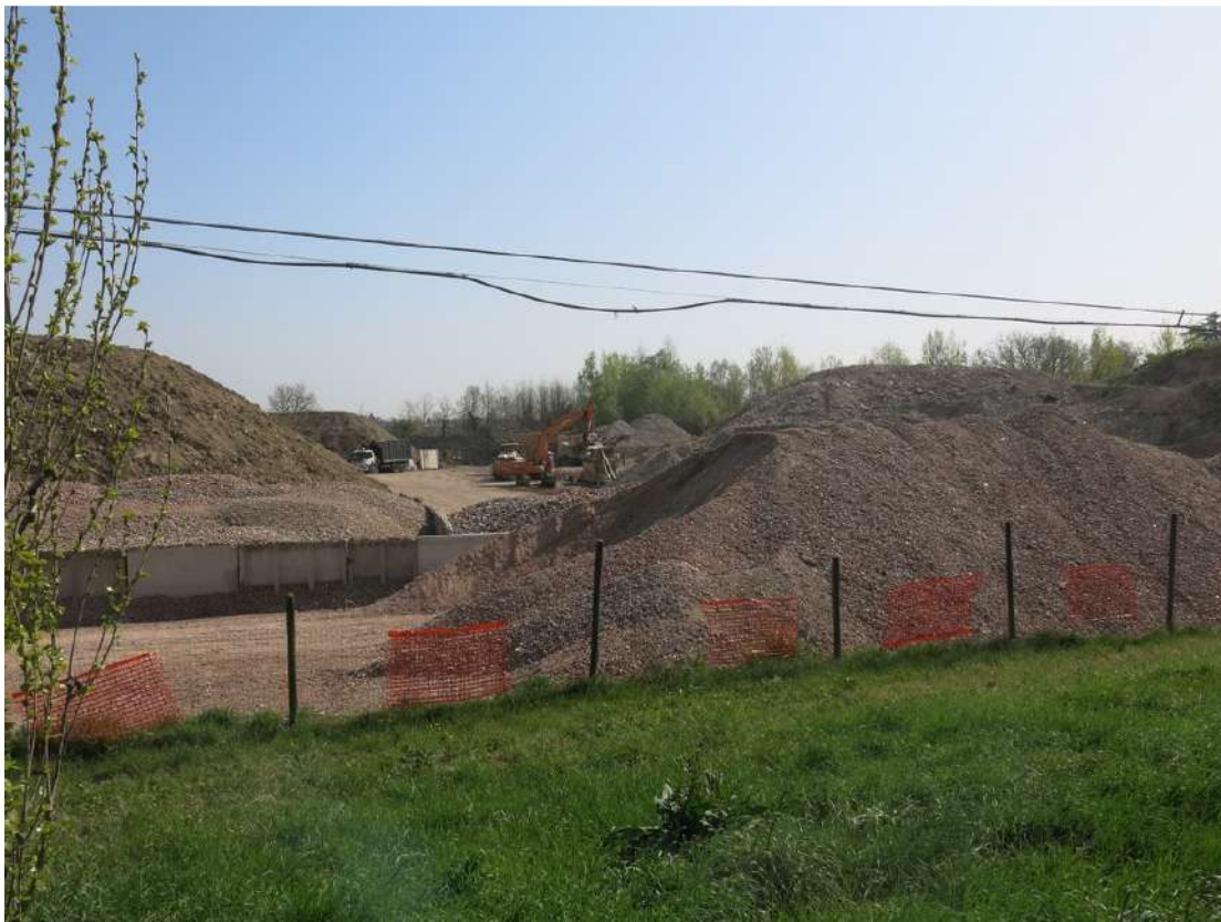
FOTO 046 - Area di lavorazione inerti all' interno dell' area di cava vista dalla sommità degli accumuli di terreno vegetale della barriera verde