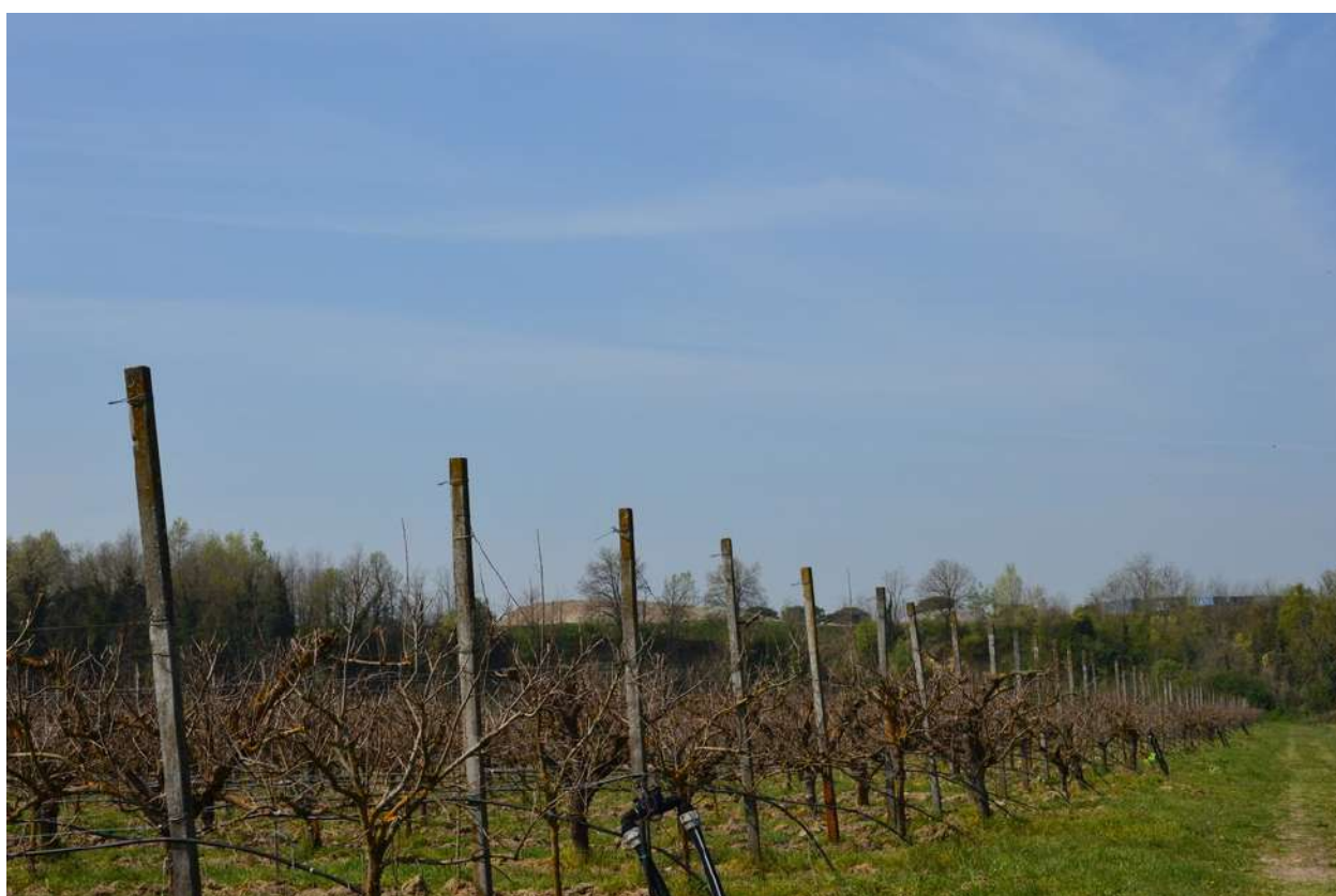
FOTO 006 - La scarpata delle chiuse del Marzeno vista da Via Sbirra