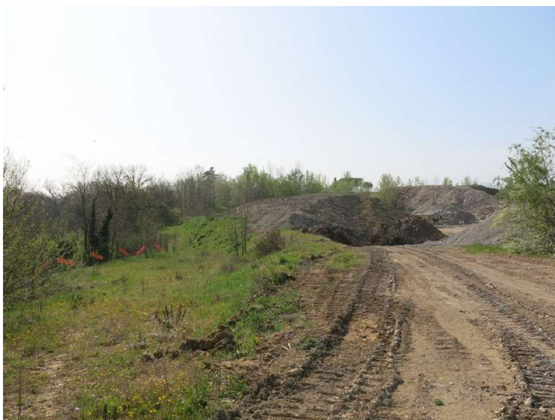
FOTO 028 - Sommità della scarpata delle chiuse del Marzeno dall' interno dell' area di Cava