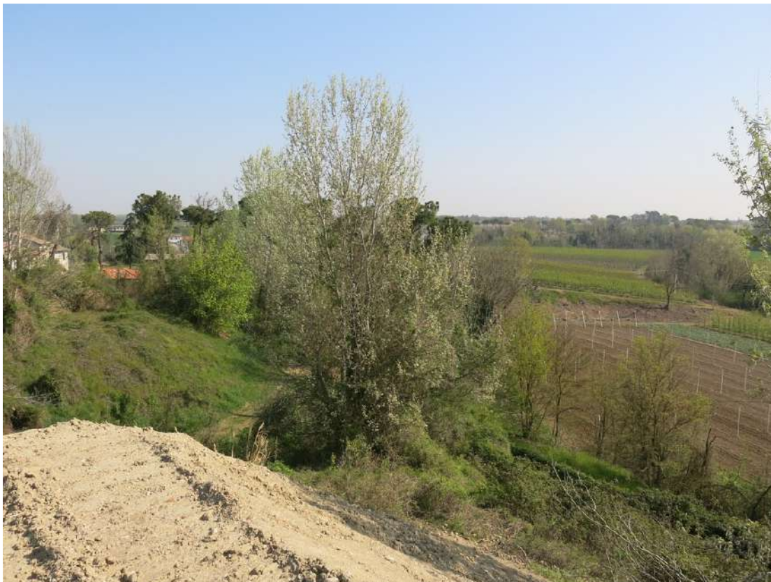
FOTO 022 - Scarpata delle chiuse del Marzeno vista dall' interno dell' area di cava dalla sommità di un accumulo temporaneo di materiale in lavorazione