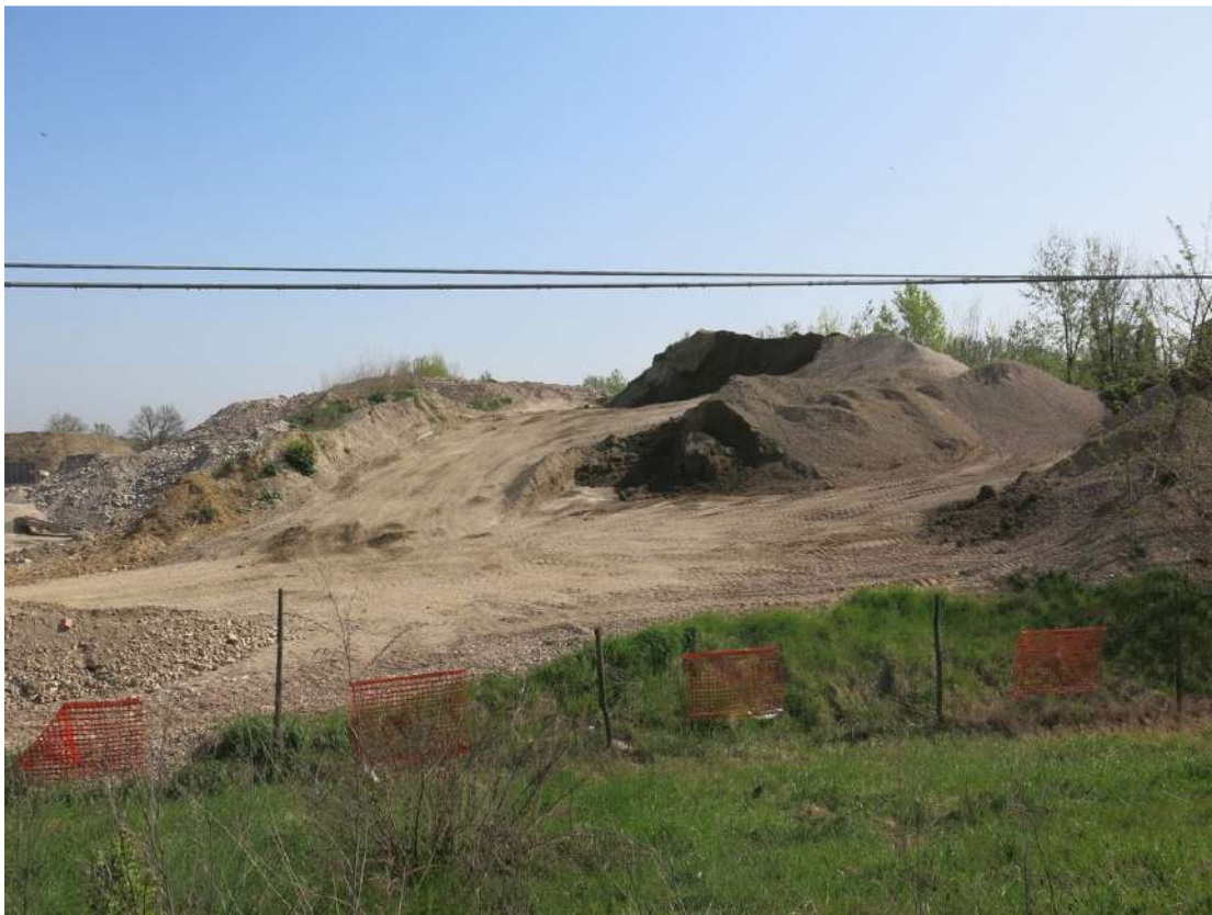
FOTO 042 - Area di lavorazione inerti all' interno dell' area di cava vista dalla sommità degli accumuli di terreno vegetale della barriera verde