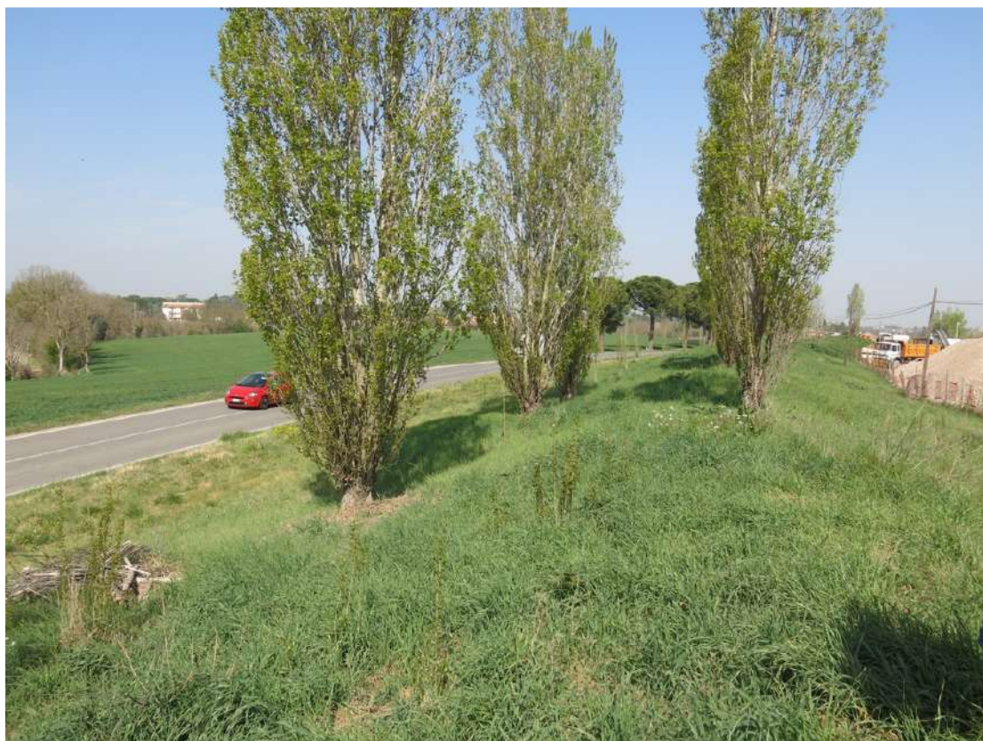
FOTO 043 - Recinzione e barriera verde sul lato occidentale - accumuli di terreno vegetale accantonato per la rinaturalizzazione del sito