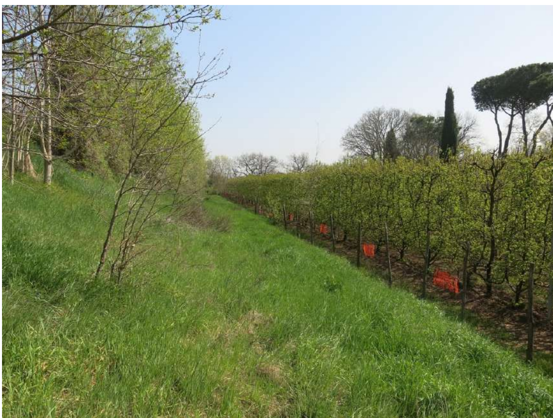
FOTO 038 - Recinzione e barriera verde sul lato meridionale - accumuli di terreno vegetale accantonato per la rinaturalizzazione del sito