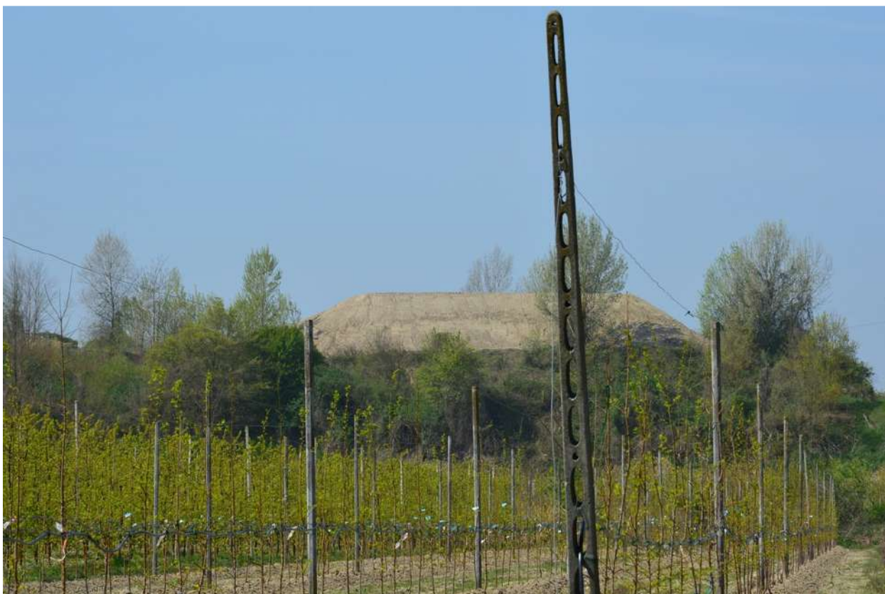
FOTO 013 - Accumuli temporanei di materiale in lavorazione all' interno dell' area di cava, visti dalla sponda opposta del torrente Marzeno