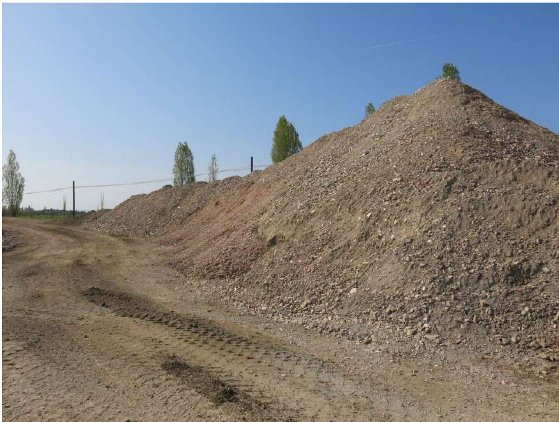
FOTO 016 - Accumuli temporanei di materiale in lavorazione all' interno dell' area di cava visti dalla viabilità interna