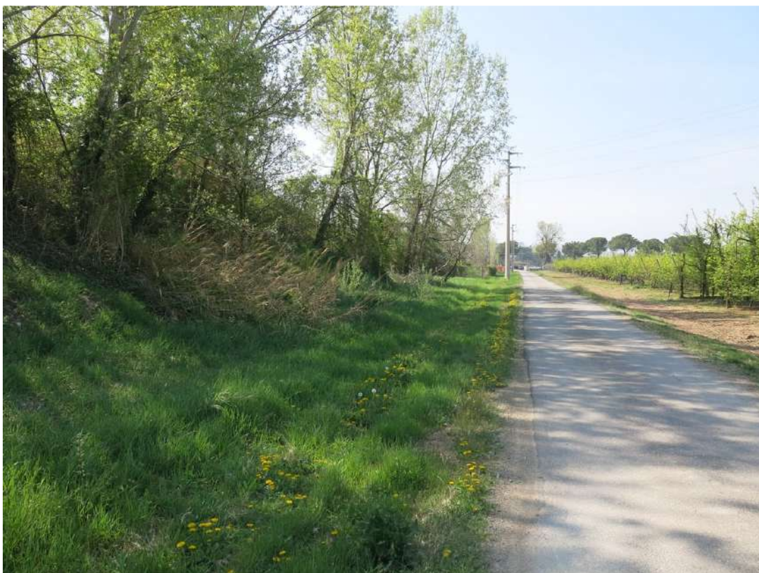
FOTO 057 - accumuli di terreno vegetale accantonato per la rinaturalizzazione del sito visti dalla strada di accesso al fondo Pignattara