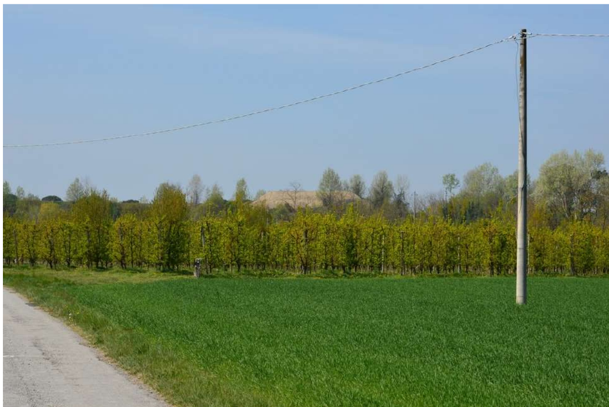
FOTO 001 - La scarpata delle chiuse del Marzeno vista da Via Sbirra