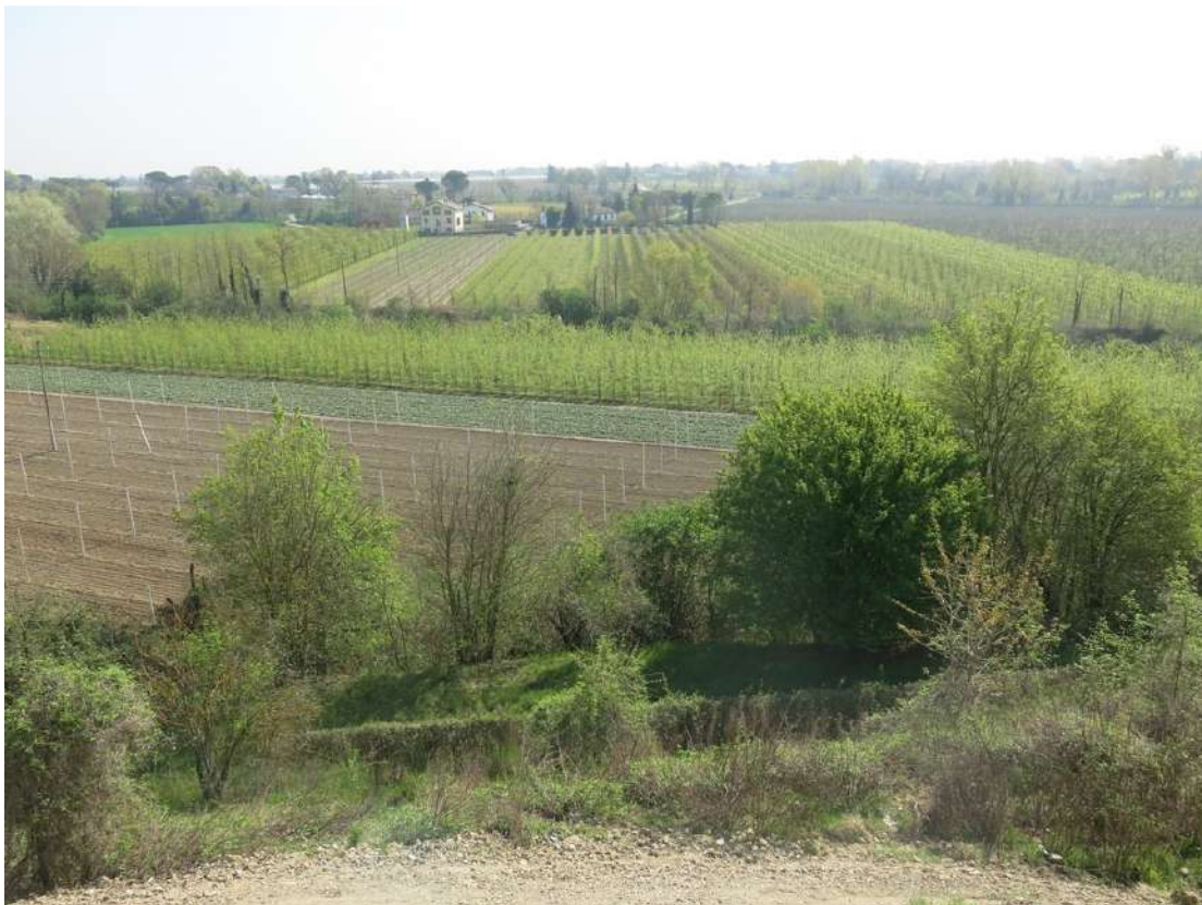
FOTO 020 - Scarpata delle chiuse del Marzeno vista dall' interno dell' area di cava dalla sommità di un accumulo temporaneo di materiale in lavorazione