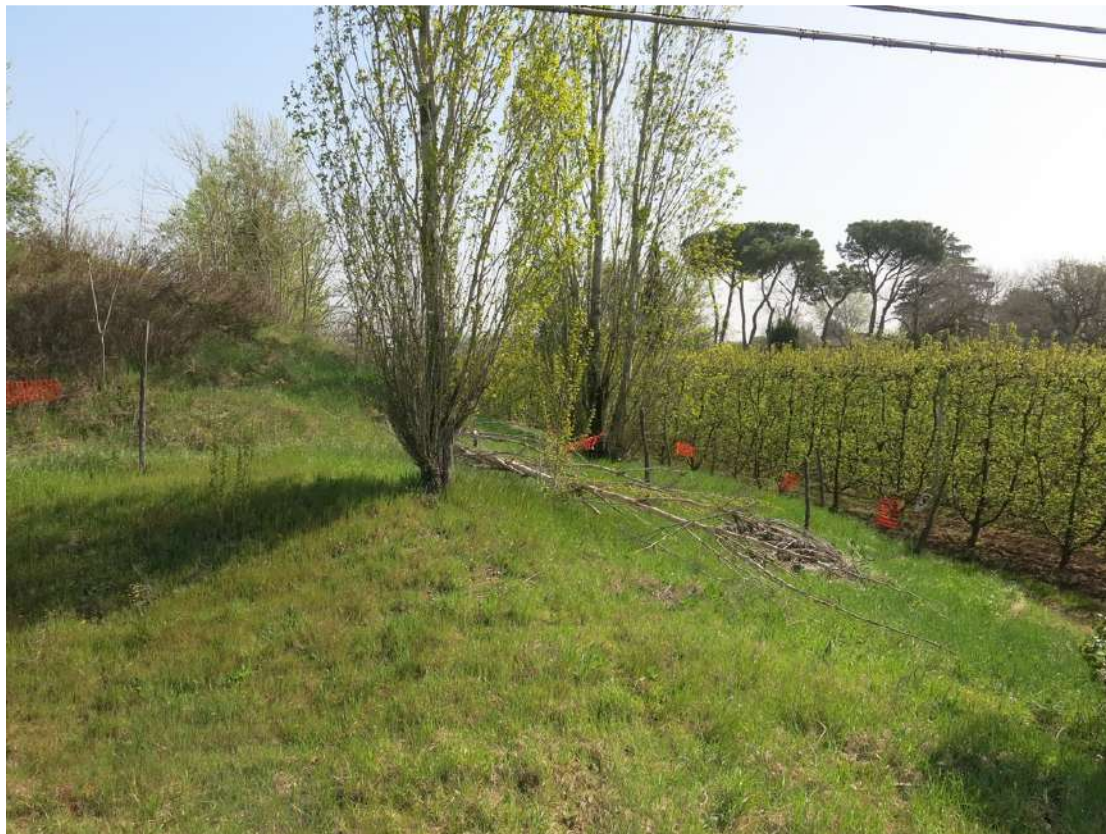
FOTO 040 - Recinzione e barriera verde sul lato meridionale - accumuli di terreno vegetale accantonato per la rinaturalizzazione del sito