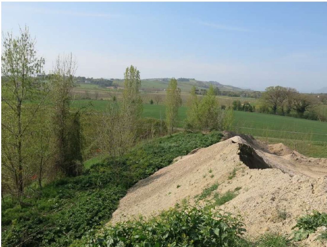
FOTO 036 - Accumuli di terreno vegetale accantonato per la rinaturalizzazione del sito e accumuli di materiale in lavorazione all' interno dell' area di cava sul lato meridionale verso la via Pittora