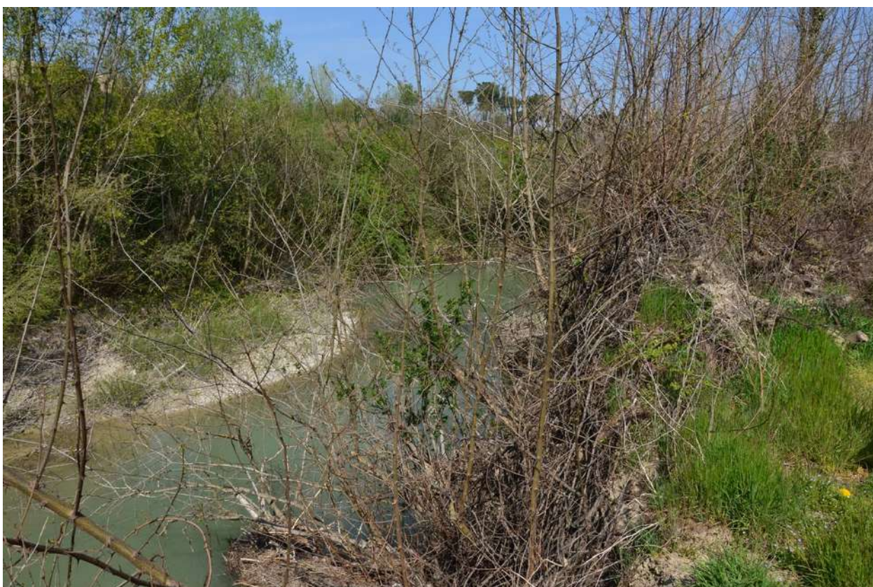
FOTO 012 - Alveo del torrente Marzeno visto dalla sponda opposta alla scarpata