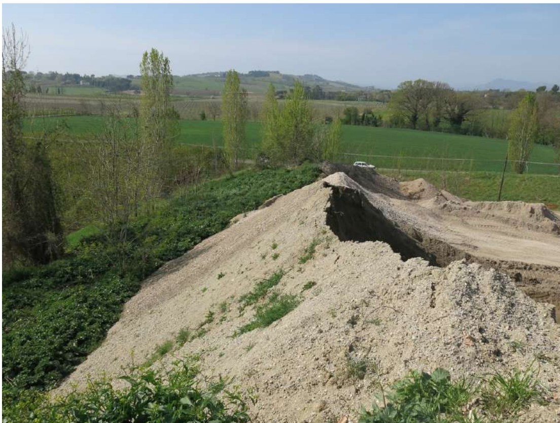
FOTO 033 - Accumuli di terreno vegetale accantonato per la rinaturalizzazione del sito e accumuli di materiale in lavorazione all' interno dell' area di cava sul lato meridionale verso la via Pittora