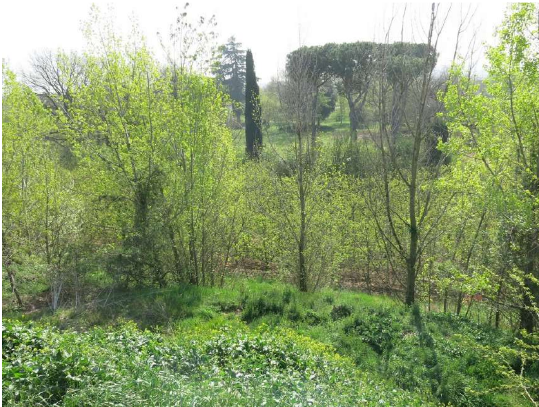
FOTO 034 - Accumuli di terreno vegetale accantonato per la rinaturalizzazione del sito sul lato meridionale verso la via Pittora