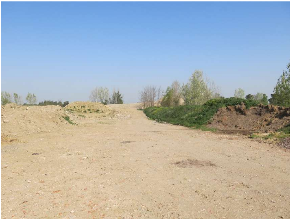
FOTO 018 - Viabilità interna all' area di cava