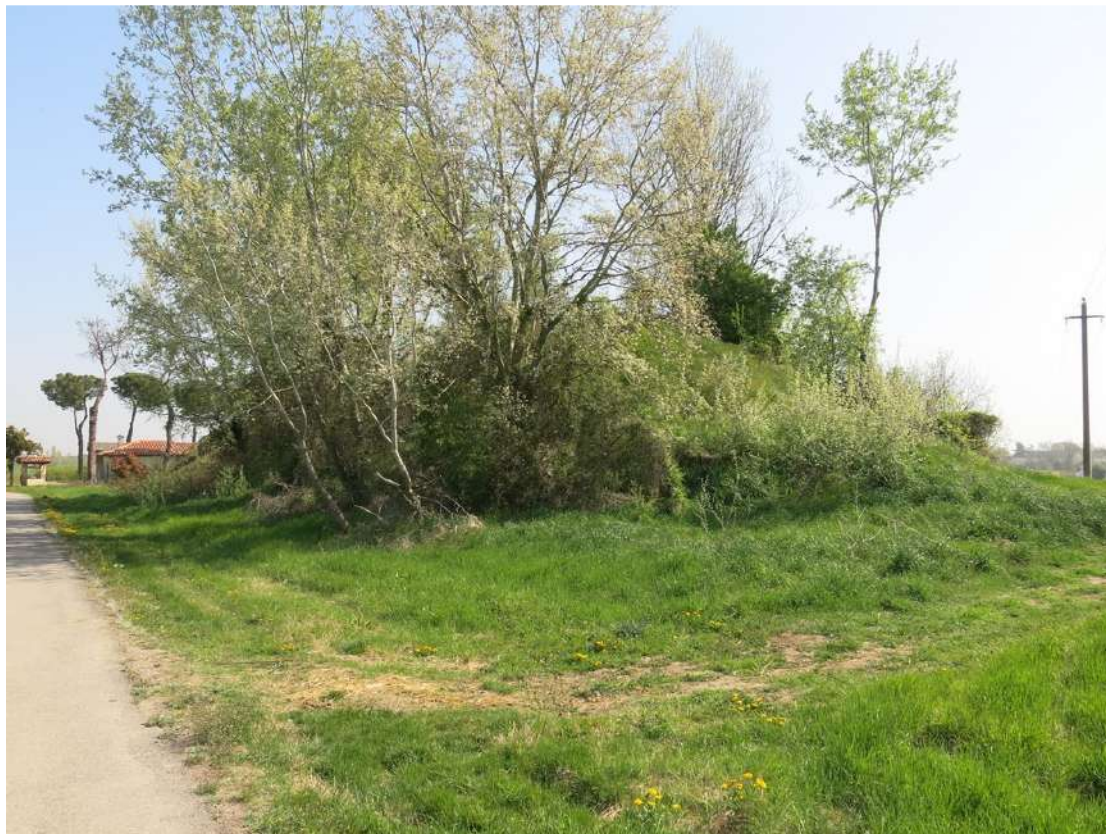
FOTO 050 - accumuli di terreno vegetale accantonato per la rinaturalizzazione del sito