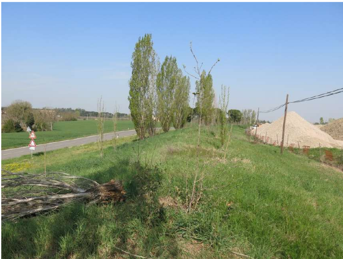
FOTO 041 - Recinzione e barriera verde sul lato occidentale - accumuli di terreno vegetale accantonato per la rinaturalizzazione del sito