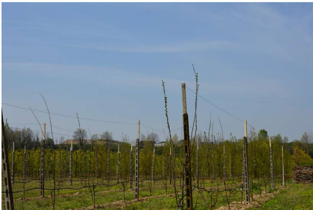
FOTO 005 - La scarpata delle chiuse del Marzeno vista da Via Sbirra