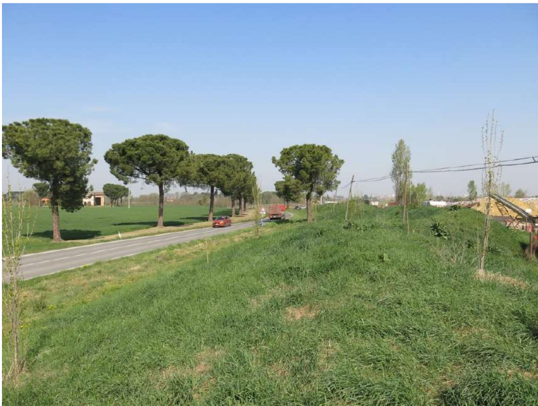
FOTO 045 - Recinzione e barriera verde sul lato occidentale - accumuli di terreno vegetale accantonato per la rinaturalizzazione del sito