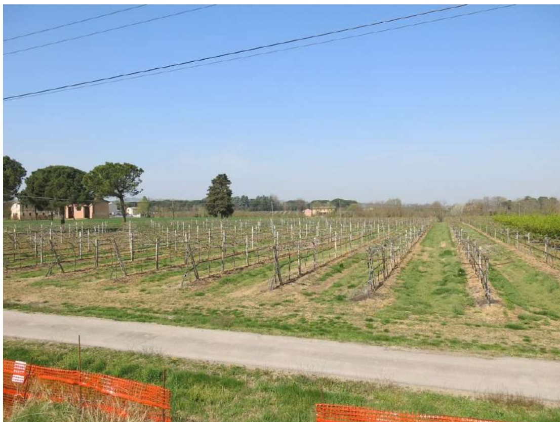
FOTO 025 - Recinzione dell' area di cava sulla strada di accesso al fondo "Pignattara"