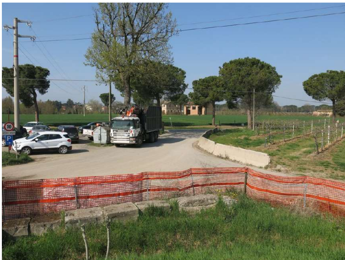
FOTO 027 - Ingresso all' area di cava