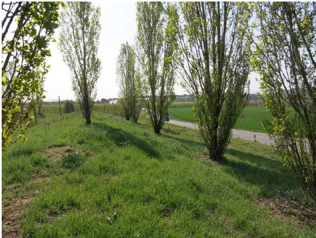
FOTO 044 - Recinzione e barriera verde sul lato occidentale - accumuli di terreno vegetale accantonato per la rinaturalizzazione del sito