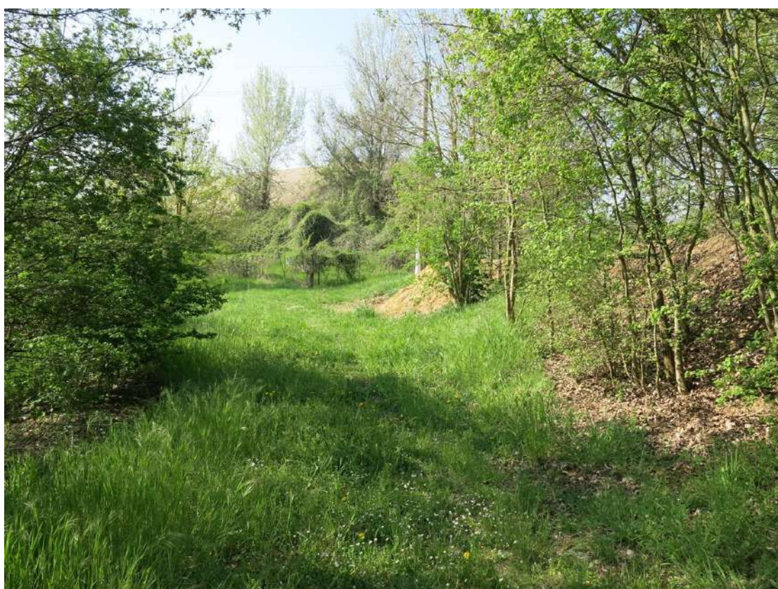
FOTO 054 - accumuli di terreno vegetale accantonato per la rinaturalizzazione del sito