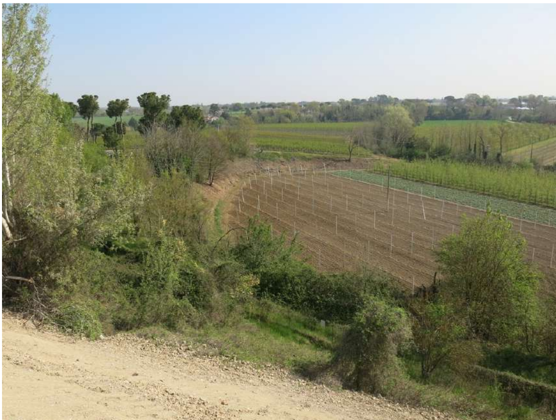
FOTO 021 - Scarpata delle chiuse del Marzeno vista dall' interno dell' area di cava dalla sommità di un accumulo temporaneo di materiale in lavorazione