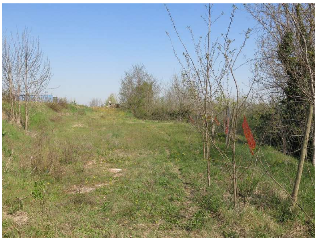
FOTO 030 - Sommità della scarpata delle chiuse del Marzeno dall' interno dell' area di Cava