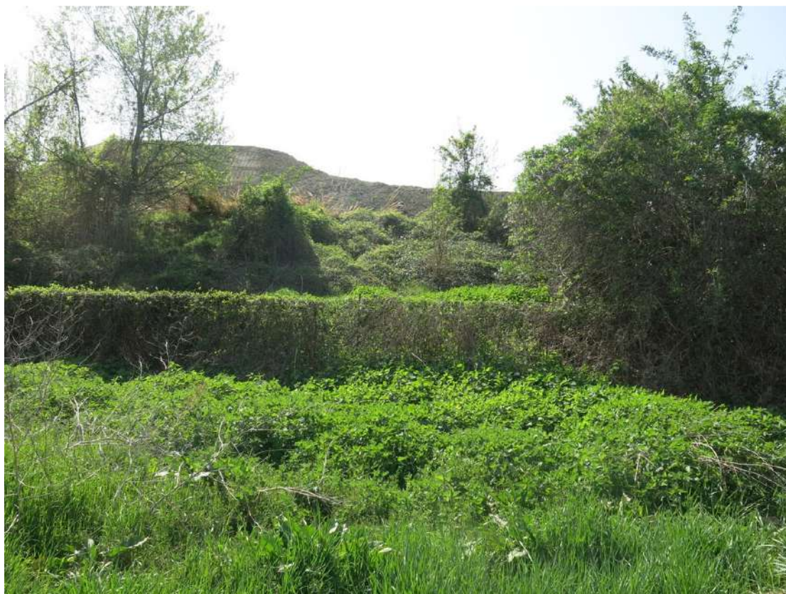
FOTO 051 - Recinzione e barriera verde sul lato settentrionale - accumuli di terreno vegetale accantonato per la rinaturalizzazione del sito - accumuli di materiale in lavorazione all' interno dell' area di cava