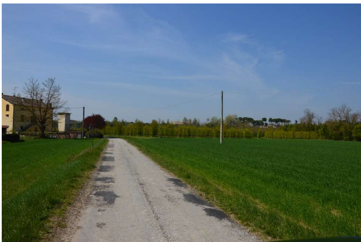
FOTO 002 - La scarpata delle chiuse del Marzeno vista da Via Sbirra